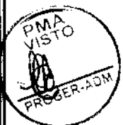
CONSTRUTORA JN E TERRAPLANAGEM LTDA CONTRATADA