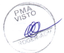
T & G ASSISTENCIA MEDICA LTDA CONTRATADA