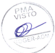
S&M SERVIÇOS MÉDICOS LTDA CONTRATADA