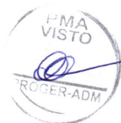
LD SERVIÇOS MEDICOS CONTRATADA