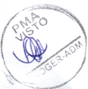
CST ASSISTÊNCIA MÉDICA EM NEFROLOGIA LTDA CONTRATADA